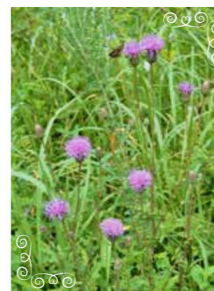
タムラソウ 「田村草」(キク科)

限られた地域にしか自生がないため、野生ではなかなか見ることのできない花ですが、箱根湿生花園では、湿生林区で観察することができます。鮮やかに咲く黄色い花は林の中でとてもよく目立っていますので、ぜひ観察してみてください。