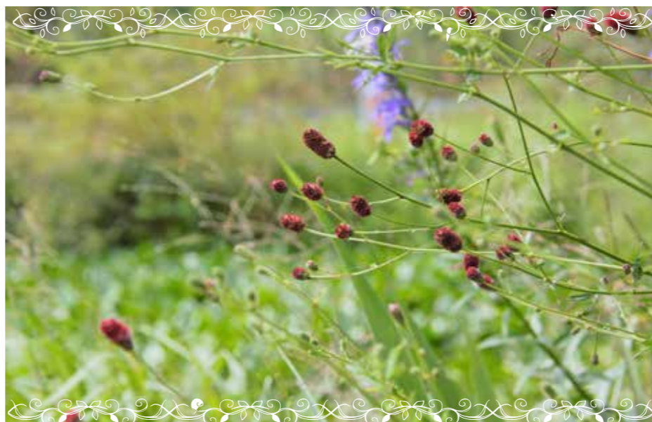
ワレモコウ「吾木香」(バラ科)

タマアジサイ 本州(主に宮城県以南の太平洋側)の山地の谷間に生える落葉低木。名前の由来は、蕾が球形をしていることから。日本固有種。