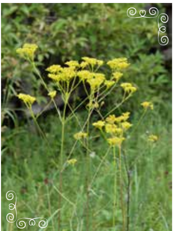
オミナエシ 「女郎花」(オミナエシ科)

日本全土の山野の日当たりの良い草地に生える多年草。秋の七草のひとつとして、古くから親しまれてきた。