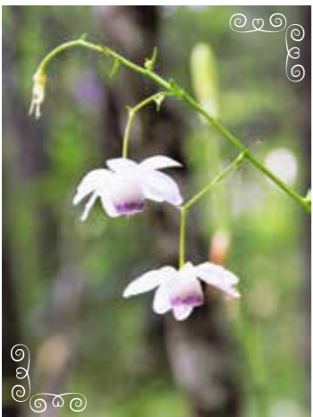
レンゲショウマ 「蓮華升麻」(キンポウゲ科)

本州(福島県~奈良県)の山地の落葉樹林内に生える多年草。ハスに似た花を下向きに咲かせる。日本特産種。