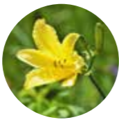
エゾキスゲ 北海道、南千島の海岸の草地や砂丘に生える多年草。夕方に開き、翌日の午後まで咲く。