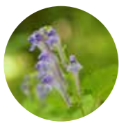
オカタツナミソウ 本州～四国の丘陵などに生える多年草。名前の由来は、丘に生え、花を波頭にとたとえたことから。