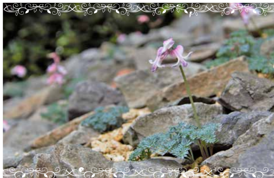
コマクサ 「駒草」 (ケシ科) 北海道、本州(中部地方以北)の高山の砂礫地に生える多年草。名前の由来は、花の形が馬(駒)に似ていることから。高山植物の女王と呼ばれる。