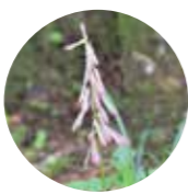
サイハイラン 北海道～九州の山地の木陰に生える多年草。名前の由来は、花序を采配(武将が指揮に用いた道具)に見立てたことから。