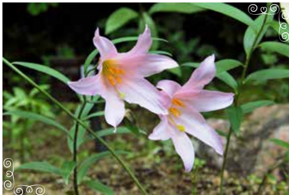
ヒメサクリ 「姫早百合」(ユリ科) 本州(山形県、福島県、新潟県)の山地の草地に生える多年草。淡紅色で芳香のある花を咲かせる。別名、オトメユリ。