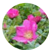
ハマナス 北海道～本州(太平洋側は茨城県以北、日本海側は島根県以北)の海岸の砂地に生える落葉低木。新皇后・雅子さまのお印。