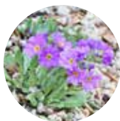
ユキワリコザクラ

北海道～九州の山野の湿ったところに生える多年草。名前の由来は、1本の茎にふつう2個の花をつけることから。