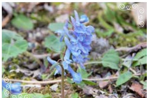
エゾエンゴサク 「蝦夷延胡索」(ケシ科)

北海道～本州(中部地方以北)の湿り気のある林内や林縁に生える多年草。花色は変異が大きい。春植物のひとつ。