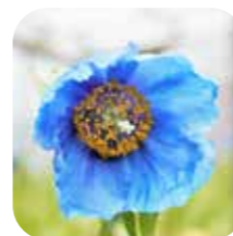
ヒマラヤの青いケシが咲き始めました! (4/14現在)

人気の「ヒマラヤの青いケシ展」は4/20(土)から開催します。「幻の花」と呼ばれるヒマラヤの青いケシをどうぞお見逃しなく!