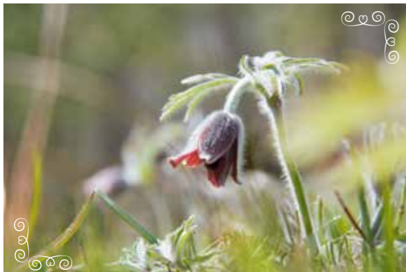
オキナグサ 「翁草」(キンポウゲ科)

本州～九州の山野の日当たりのよい草地生える多年草。花は下向きに咲く。名前の由来は、白く長い毛を持つ果実の集まりを老人の白髪にたとえたことから。