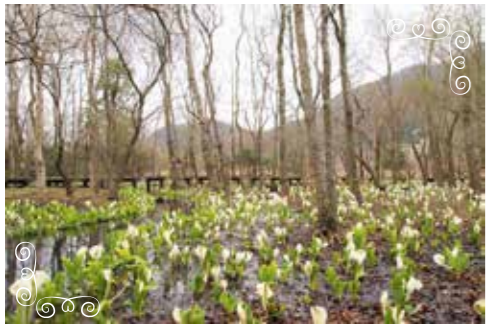
ミズバショウ (昨年3月下旬の様子)