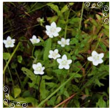
ウメバチソウ 「梅鉢草」(ユキノシタ科)

北海道～九州の山野の明るく湿った草原に生える多年草。名前の由来は、天満宮の御紋でもある梅鉢紋に花の形が似ることから。植生復元区ではウメバチソウの群生を観察することができます。