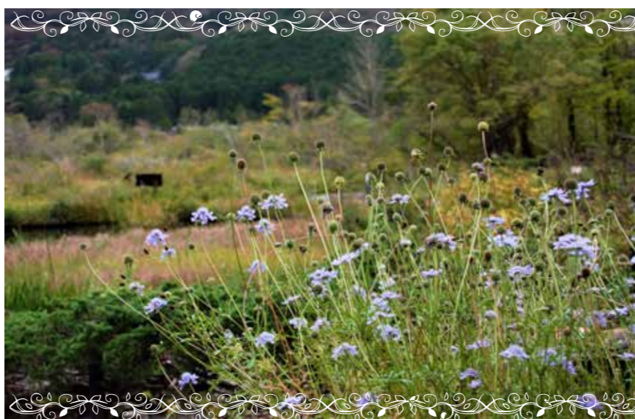
マツムシソウ 「松虫草」(マツムシソウ科)

コムラサキ 本州～沖縄の山麓の湿地や湿った原野に生える落葉低木。園芸店でムラサキシキブと売られているもの多くは本種。