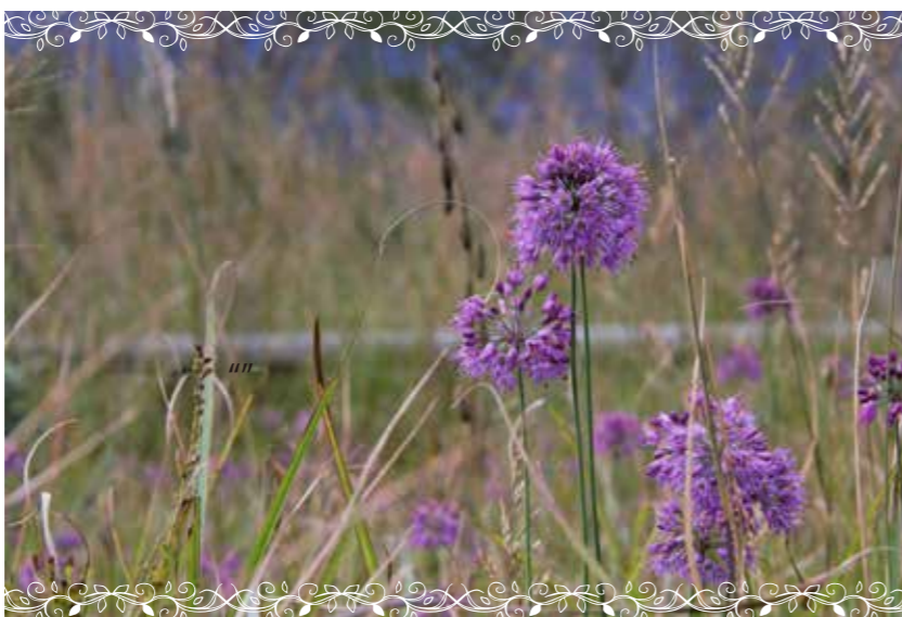
Pick Up ヤマラッキョウ 「山辣韭」ユリ科

本州(中部地方東南部、関東地方西部)の山地の湿り気のある岩地に生える多年草。趣のある鐘形の花を咲かせる。ふつう花色は紫色だが、白花品もある。人気の高い秋の山野草のひとつ。