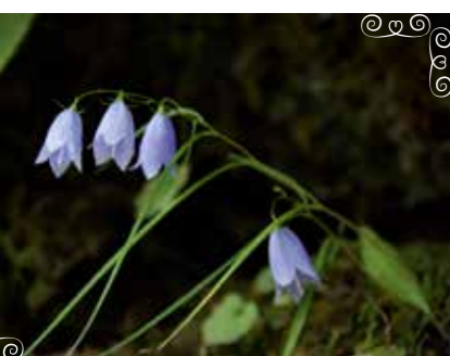
イワシャジン 「岩沙参」(キキョウ科)

『箱根湿生花園ナイトパーク』 10/1(月)～11/30(金) 16:30～18:00 上記期間は、園内をライトアップし、開園時間を1時間延長して営業します。美しくライトアップされた園内をご家族やカップルでお楽しみいただけます。16:30以降入園のお客様は、夜間特別料金500円(最終入園17:30)となります。